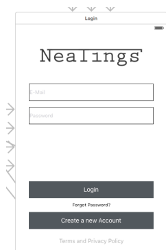
Abb. 2: Loginscreen

Die mobile App ist als Guide konzipiert, der durch eine Veranstaltung führt.